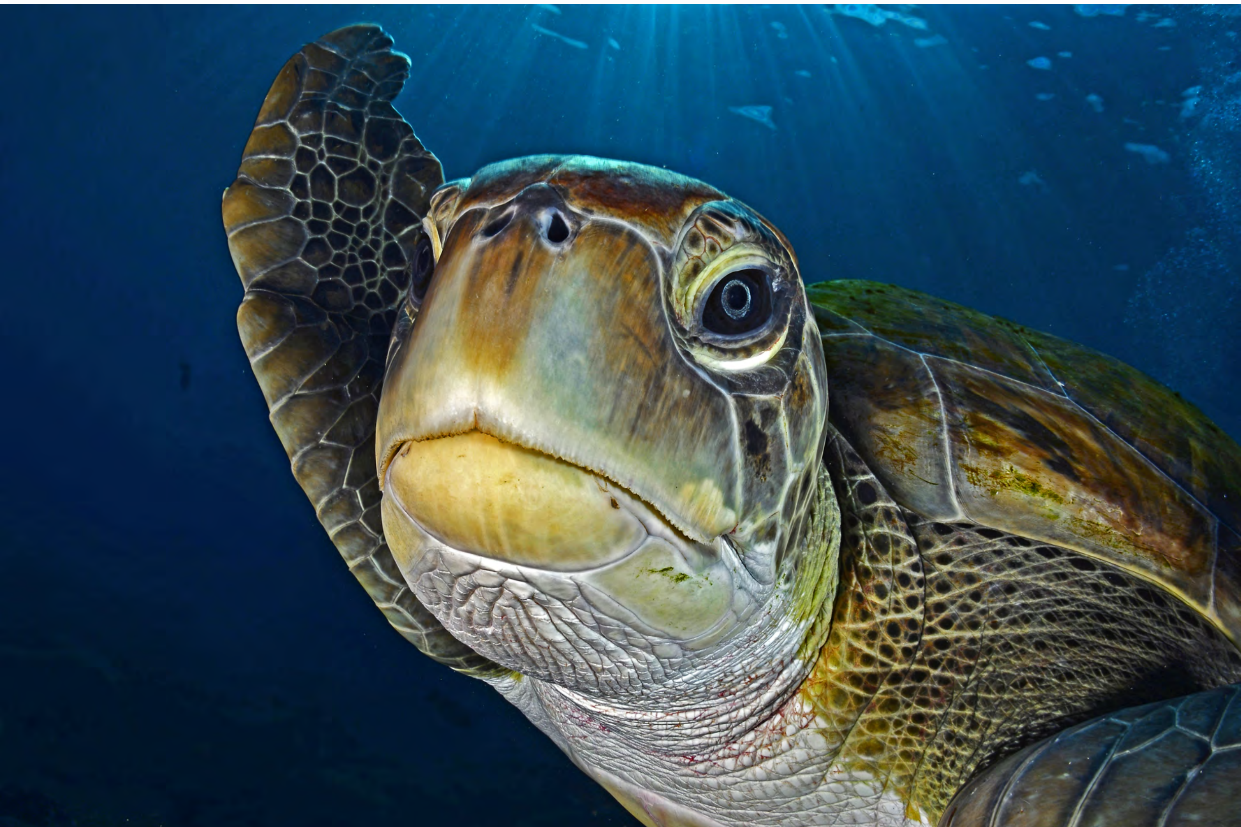
Caretta caretta - Tartaruga marina comune.