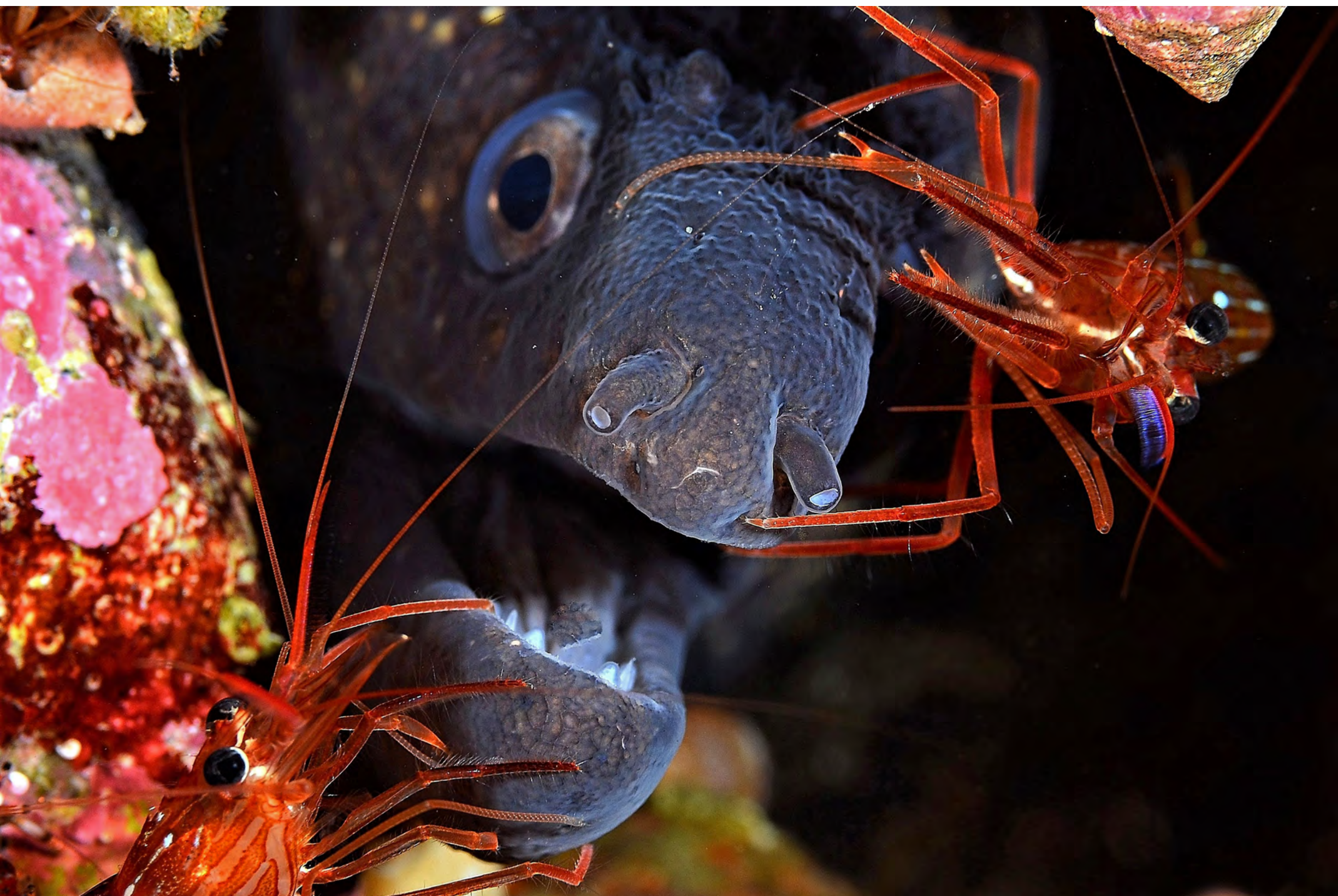
Murena helen - Murena con gamberetti pulitori.