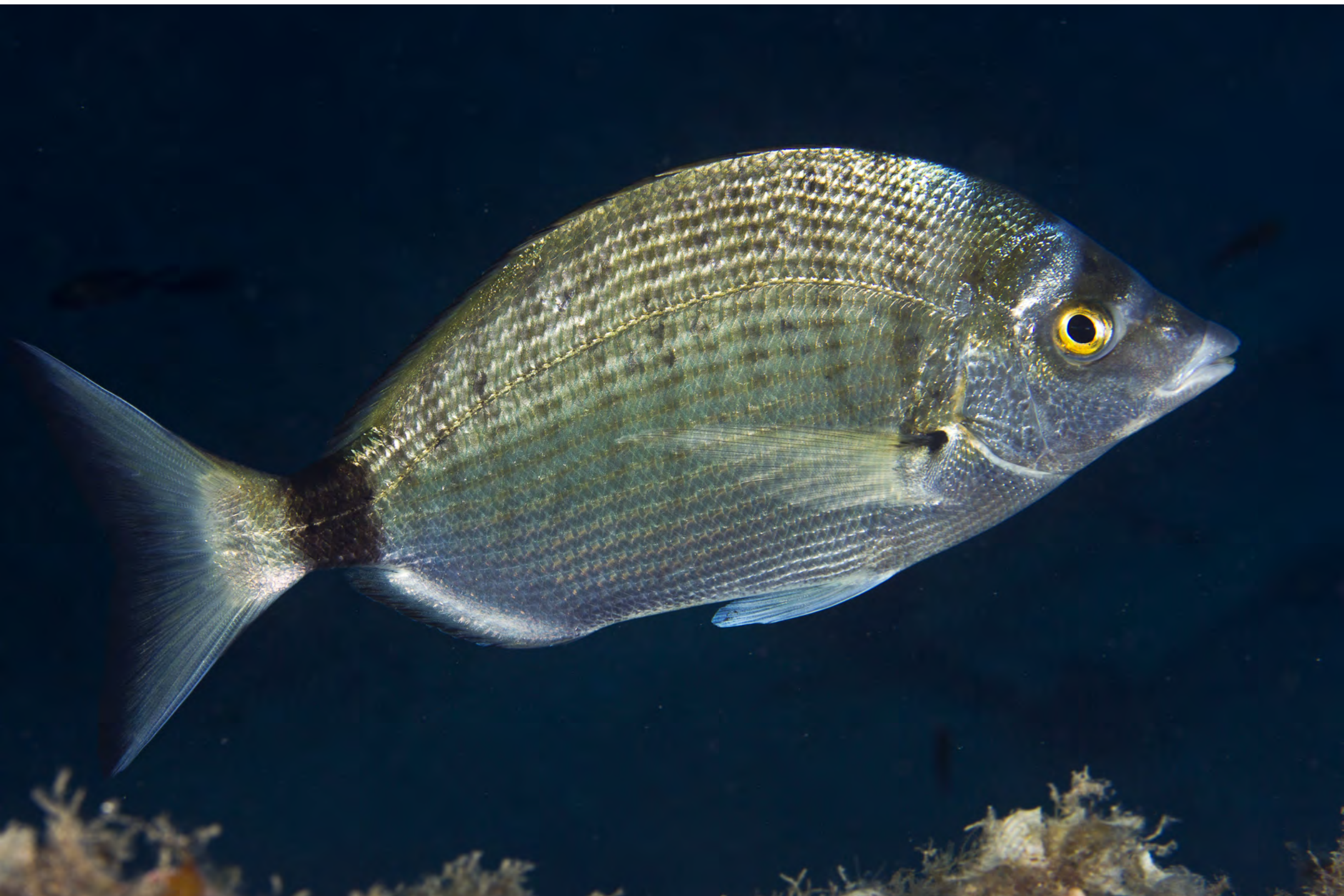
Diplodus puntazzo - Sarago pizzuto.