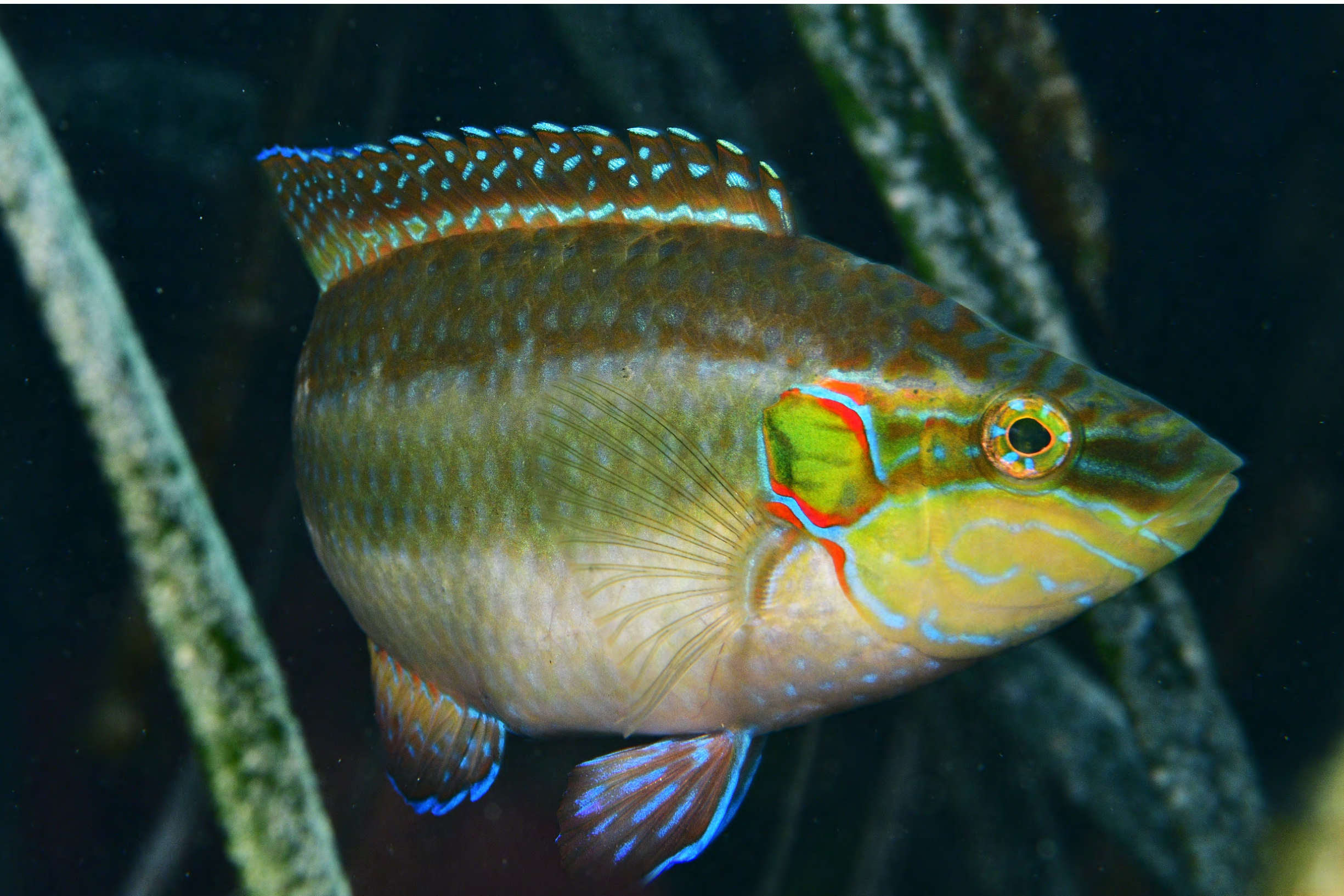
Symphodus ocellatus - Tordo ocellato.