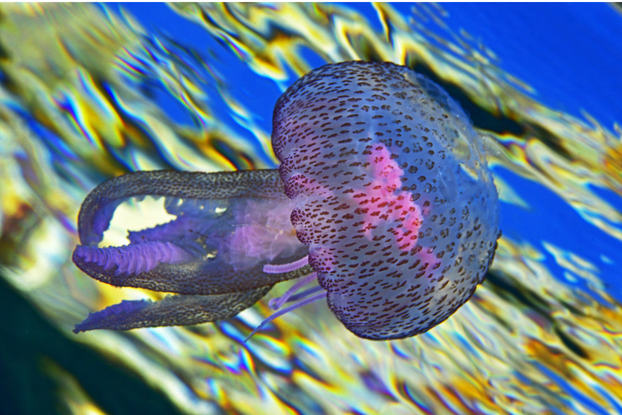
Pelagia noctiluca - Medusa luminosa.