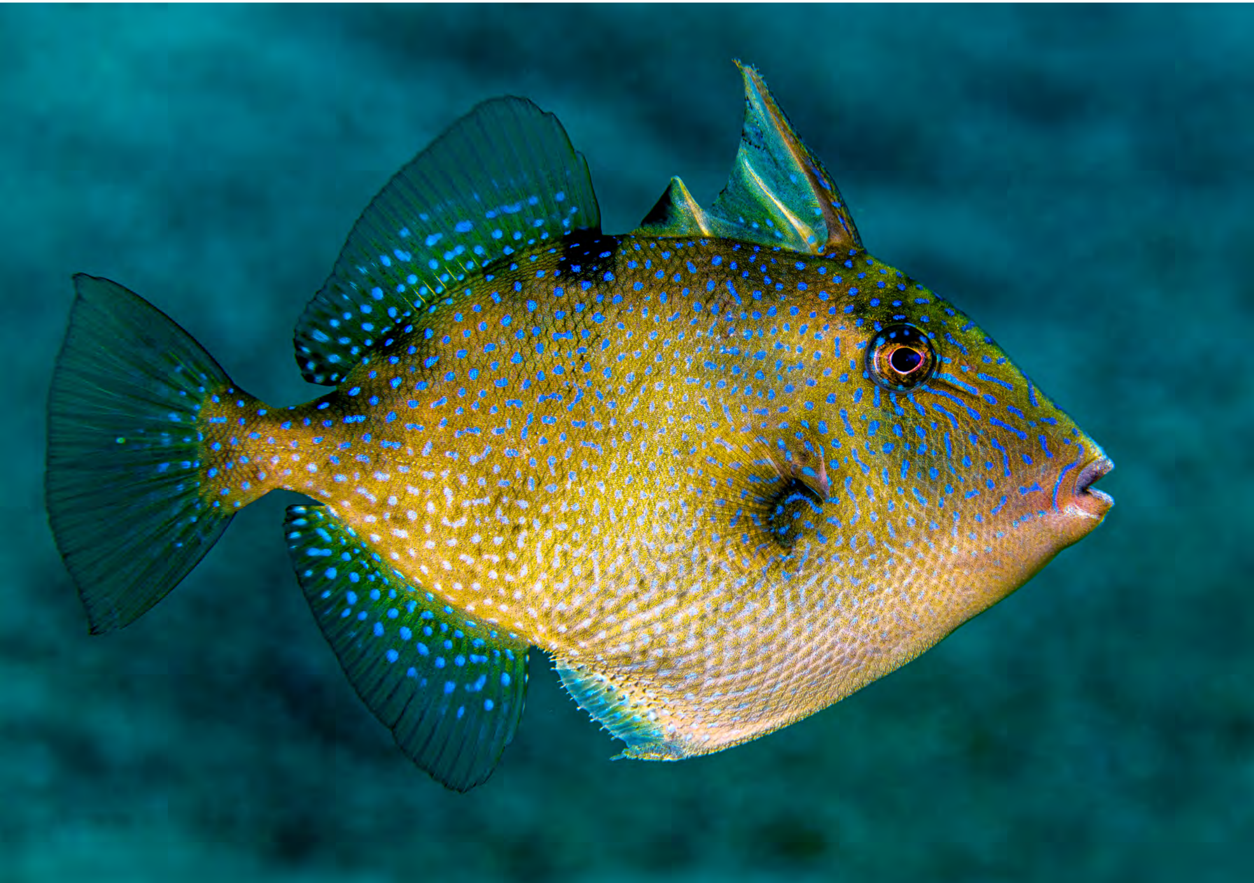
Balistes capriscus - Pesce balestra.