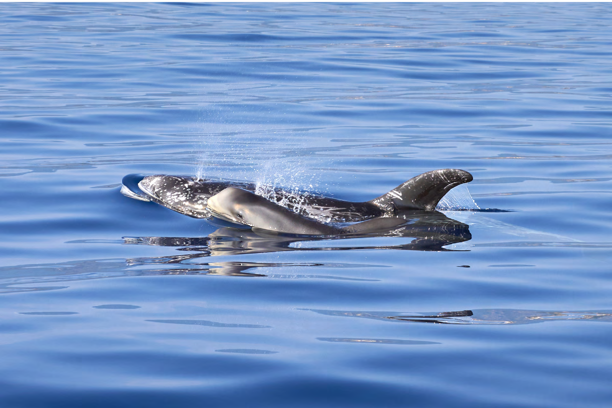
Grampus griseus - Grampo.