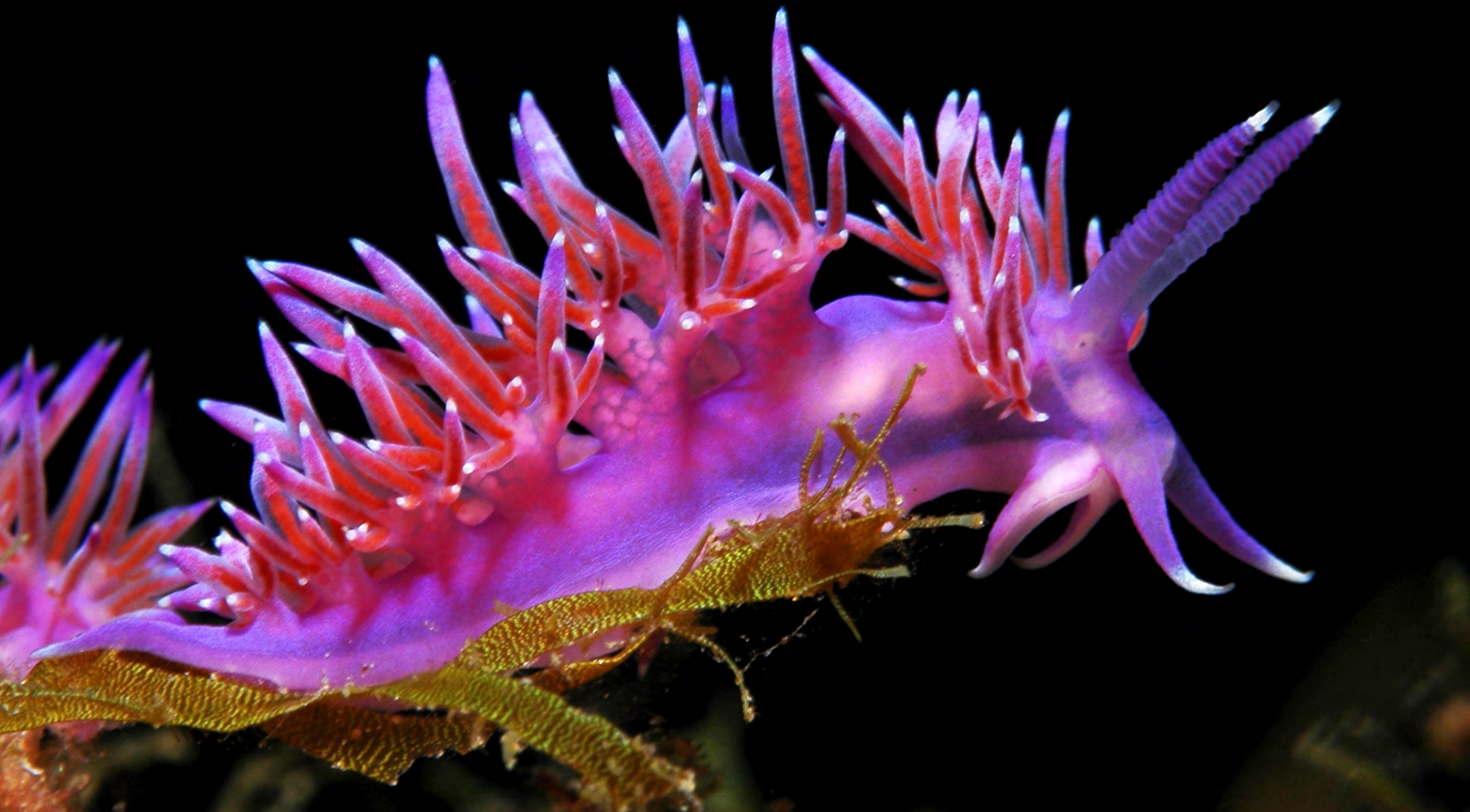
Flabellina affinis - Flabellina rosa . Ph Antonio Gagliardi