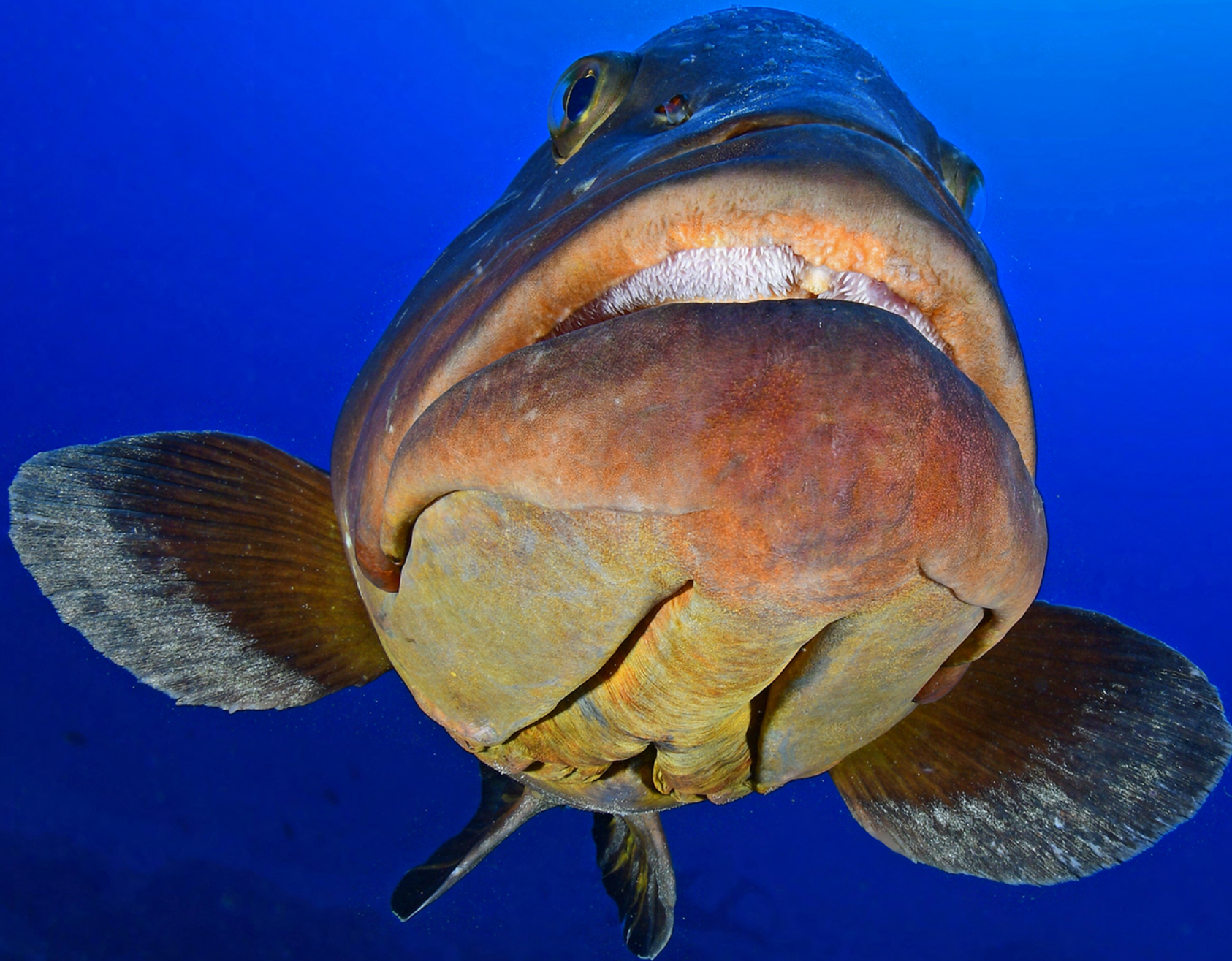
Epinephelus marginatus - Cernia bruna.

L'Ente Parchi Marini Regionali per la Calabria è distribuito su gran parte del territorio regionale ed ha una estensione di circa 17.000 ha. Interessa le aree costiere e marine calabresi più rappresentative e di pregio, dal punto di vista paesaggistico, naturalistico e biologico.