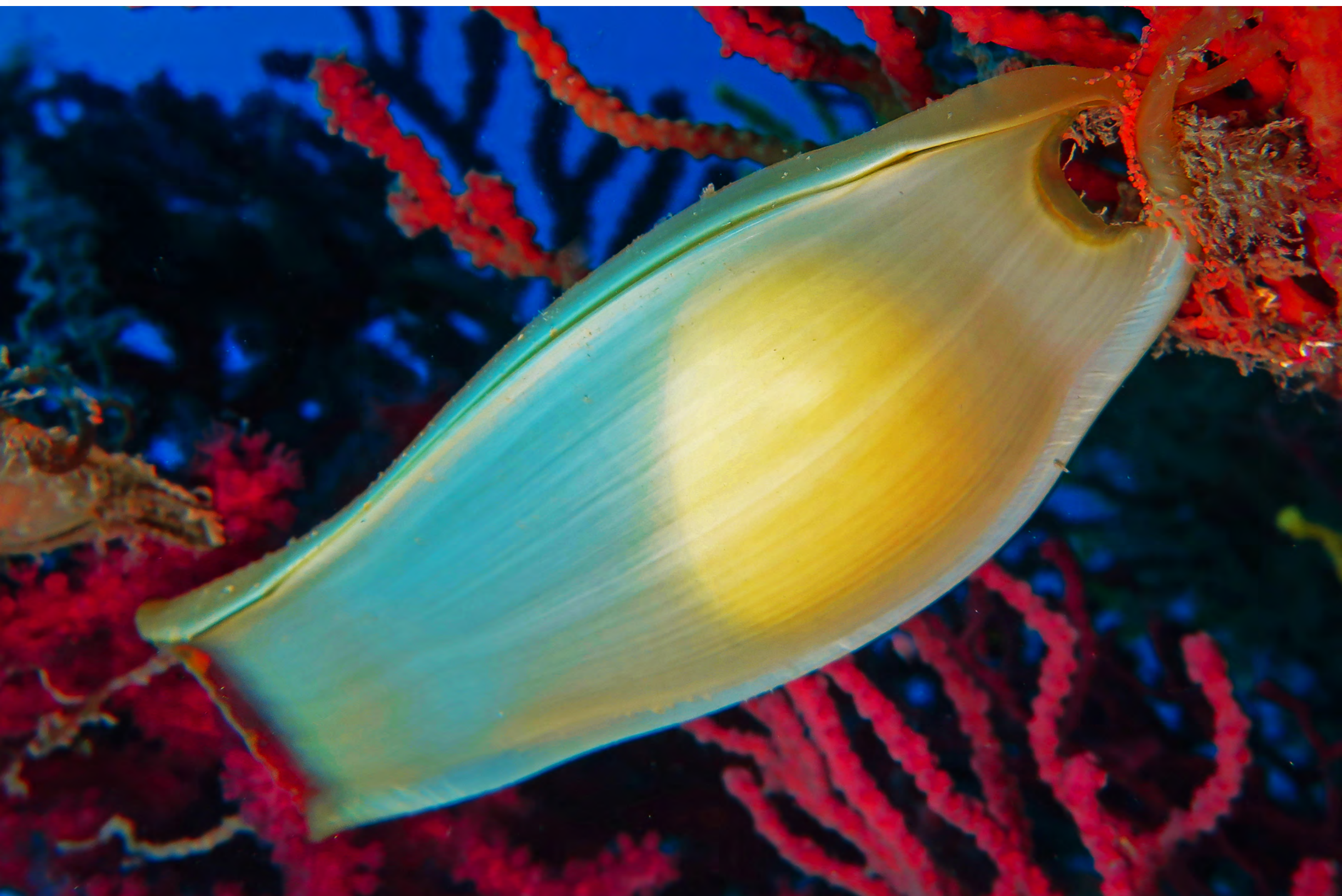
Embrione di Scyliorhinus canicula - Gattuccio.