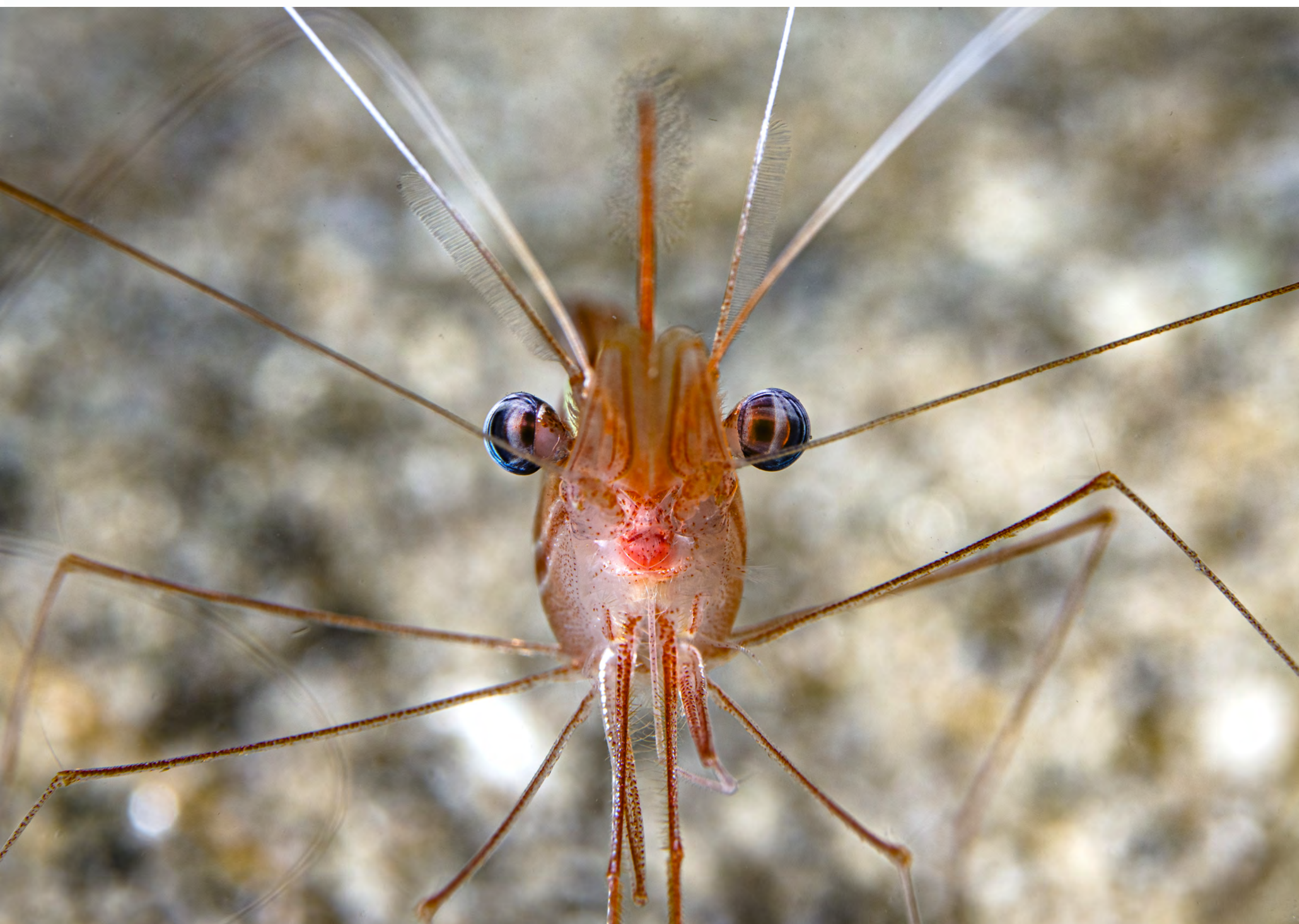
Plesionika narval - Parapando.